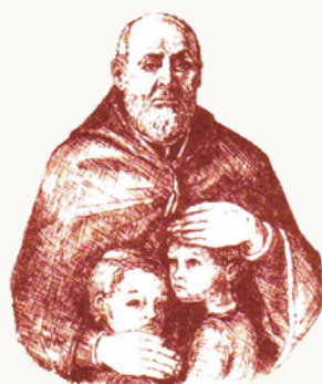
FUNDACJA IM. BRATA ALBERTA